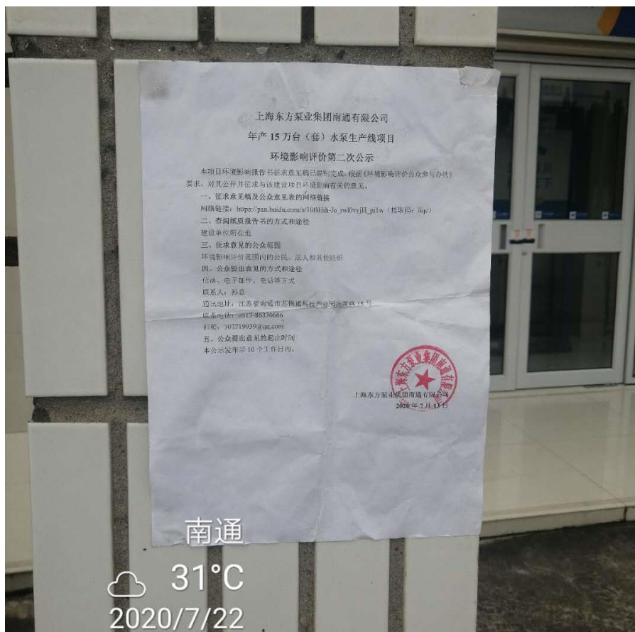
图 3-3.8 张贴情况（2020 年 7 月 22 日）