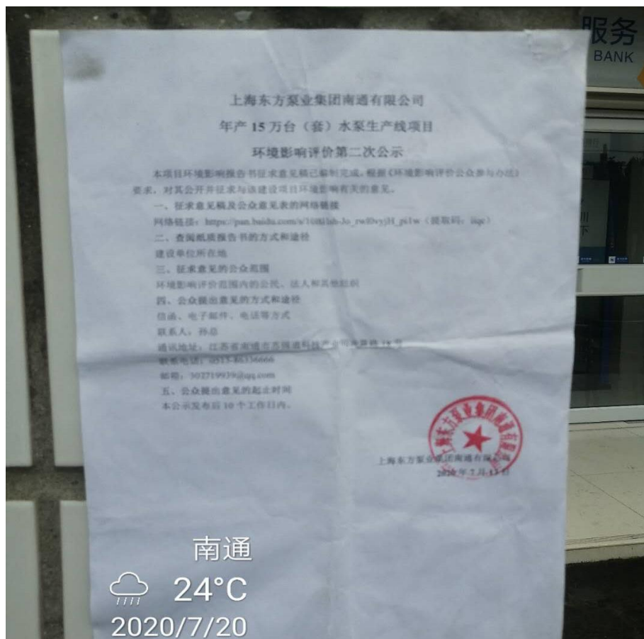
图 3-3.6 张贴情况（2020 年 7 月 20 日）