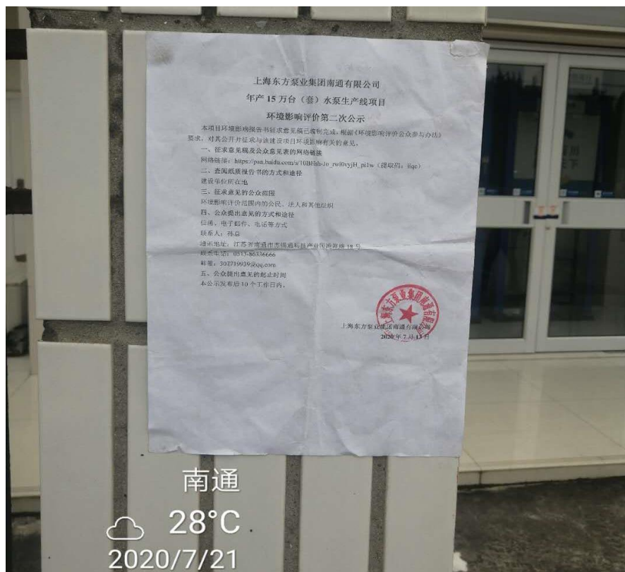
图 3-3.7 张贴情况（2020 年 7 月 21 日）