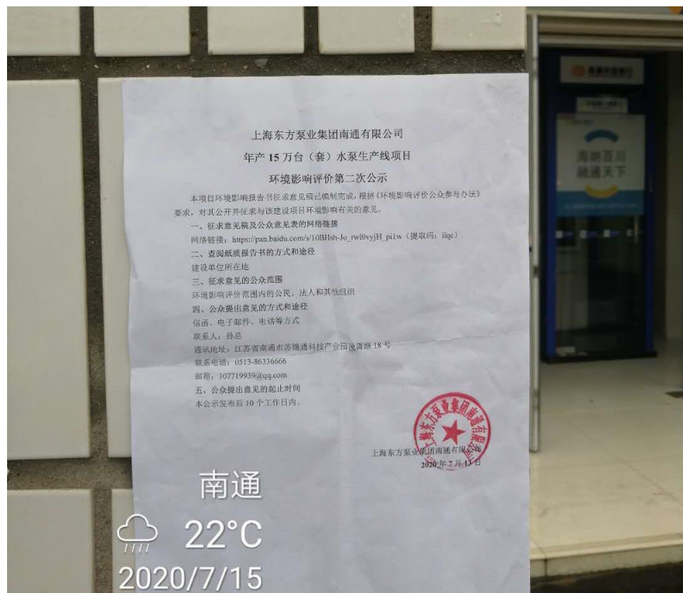
图 3-3.3 张贴情况（2020 年 7 月 15 日）