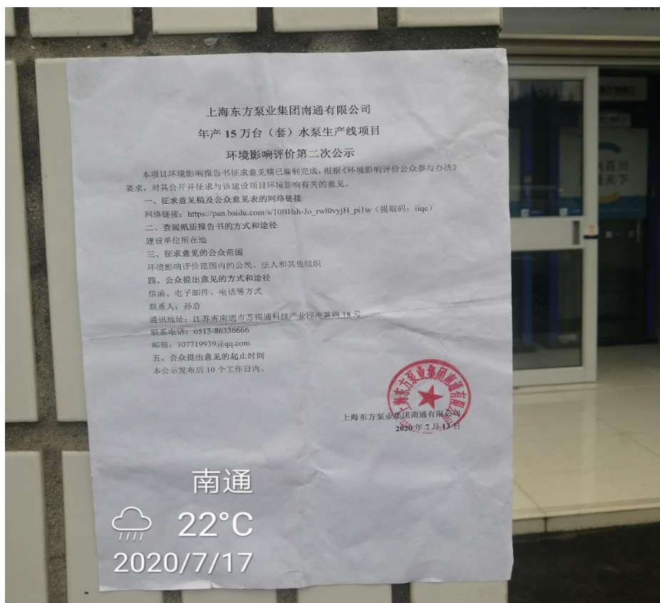
图 3-3.5 张贴情况（2020 年 7 月 17 日）