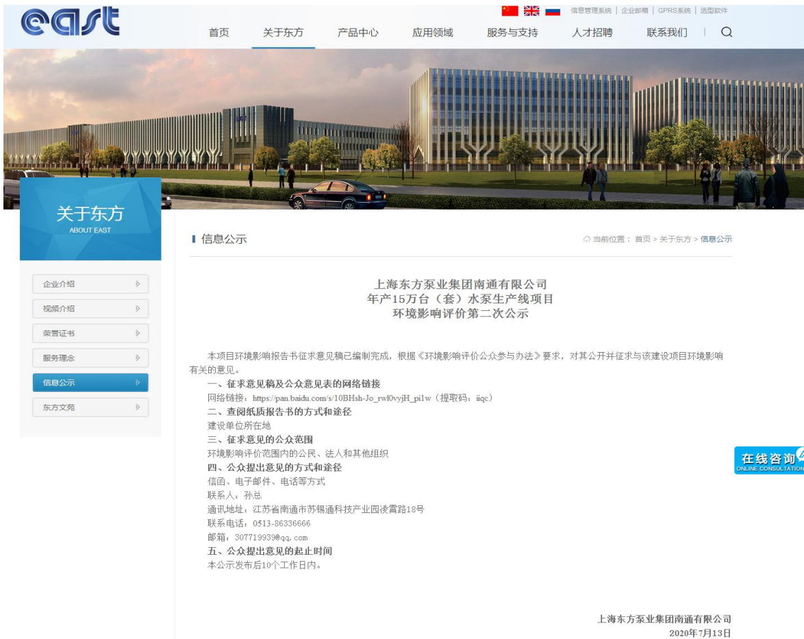
图 3-1 网络公示截图

在东方泵业公司网站（ http://www.eastpump.com/componentsingle_18.shtml ）进行征求意见稿的公示，该网站为官方对外公开网站，公示时间为2020年7月13日起10个工作日，符合《环境影响评价公众参与办法》中“通过网络平台公开，且持续公开期限不得少于10个工作日”要求。公示截图见下图。