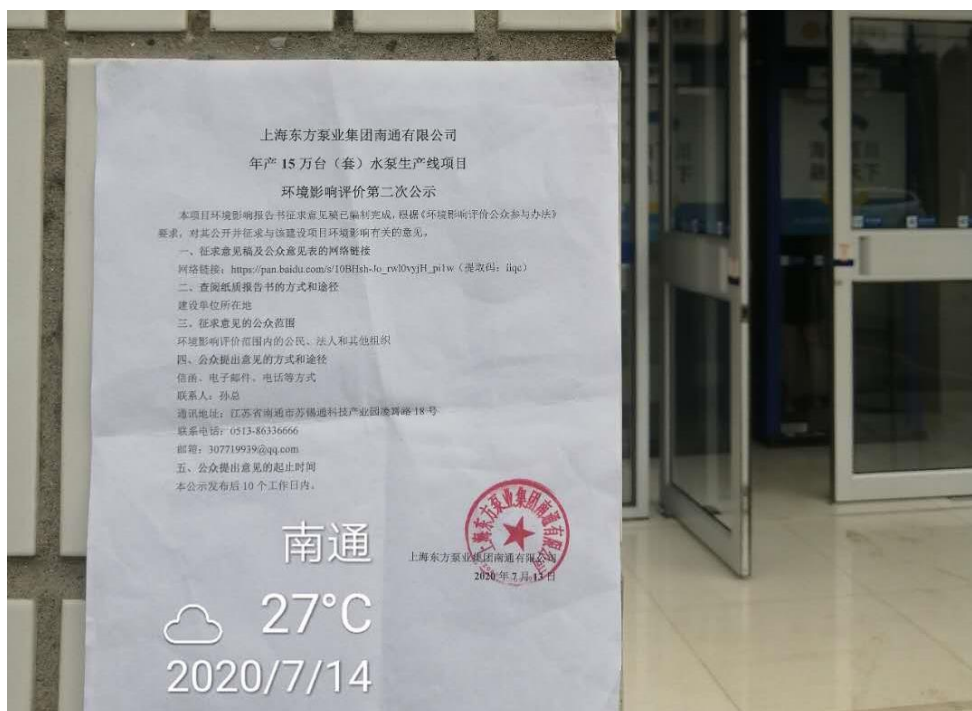
图 3-3.2 张贴情况（2020 年 7 月 14 日）