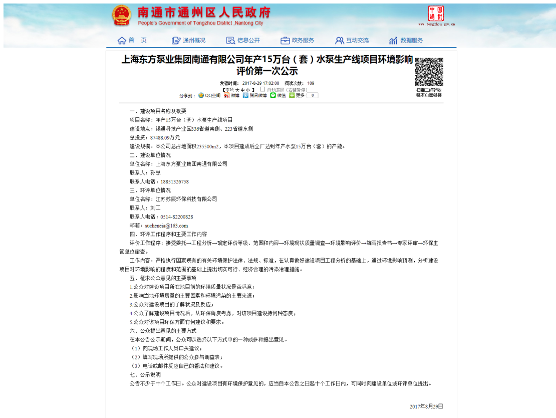
图 2-1 首次公开信息截图

在南州市通州区人民政府网站进行首次信息公开，该网站为官方对外公开网站，符合《环境影响评价公众参与暂行办法》（环发〔2006〕28 号）中“在建设项目所在地的公共媒体上发布公告；公开免费发放包含有关公告信息的印刷品；其他便利公众知情的信息公告方式”公开信息的形式要求。