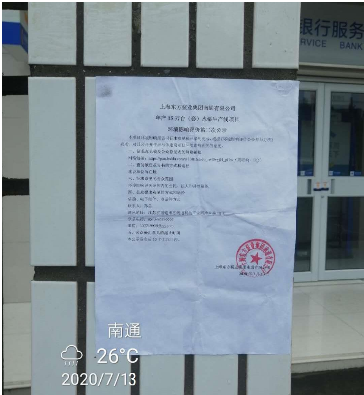
图 3-3.1 张贴情况（2020 年 7 月 13 日）

建设单位于 2020 年 7 月 13 日-24 日于项目地附近天勤家园小区入口进行了现场公示，符合《环境影响评价公众参与办法》中“通过在建设项目所在地公众易于知悉的场所张贴公告的方式公开，且持续公开期限不得少于 10 个工作日”。张贴情况见图 3-3.1~图 3-3.10 所示。