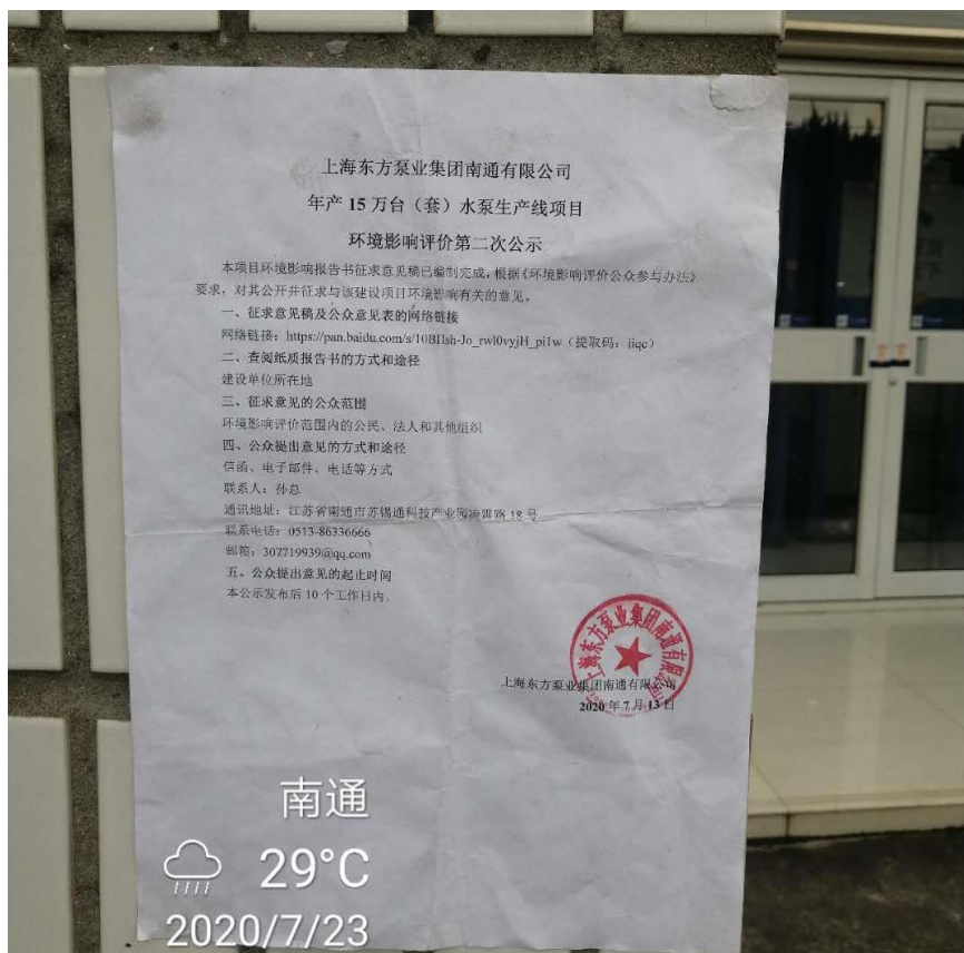
图 3-3.9 张贴情况（2020 年 7 月 23 日）