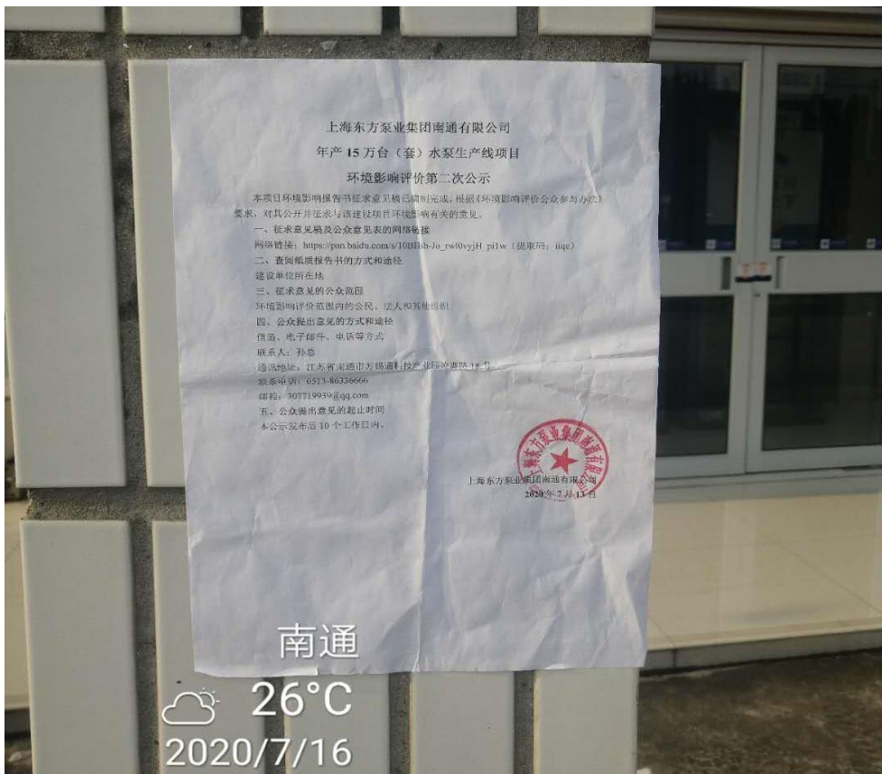
图 3-3.4 张贴情况（2020 年 7 月 16 日）